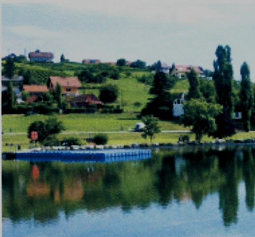
Čisto jezero privablja kopalce od blizu in daleč.

vse skupine vseh starosti in profesionalni športniki. Razlika vadbe med amaterji in profesionalci je v številu ponovitev, hitrosti in gibljivosti. Poleg veselja in za-