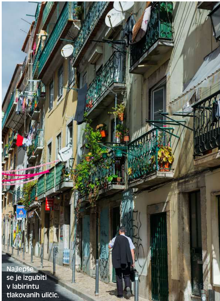
Najlepše se je izgubiti v labirintu tlakovanih uličic.

Čprav sistem podzemne železnice v Lizboni deluje zelo dobro, boste v mestu še hitreje, če boste prevoz z letališča naročili prek aplikacije Uber, ki deluje brezhibno in poceni. Voznik naj vas za nekaj evrov zapelje do The Amoreiras Wall, t. i. lizbonske stene slavnih, v prestižni četrti Amoreiras, med trgoma Amoreiras in Marquês de Pombal Squareso, ki je največja takšna galerija