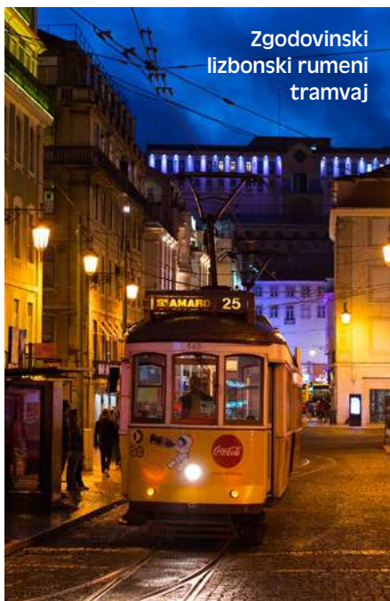
Zgodovinski lizbonski rumeni tramvaj