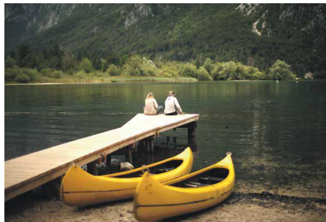
Dolgoročna usmeritev slovenskega turizma pod sloganom Slovenija – zelena, aktivna, zdrava se bo obrestovala tudi v pokoronskem obdobju, je prepričan sogovornik.

Nekateri turistični delavci opozarjajo, da so v deprivilegiranem položaju, saj so boni namenjeni le nastanitvam, ki pa menda prinesejo le kakšno petino v turistični proračun.