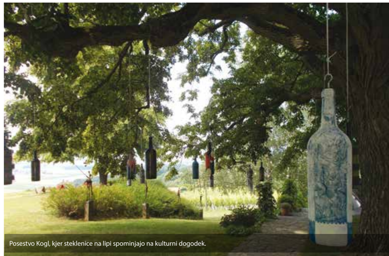
Posestvo Kogl, kjer steklenice na lipi spominjajo na kulturni dogodek.