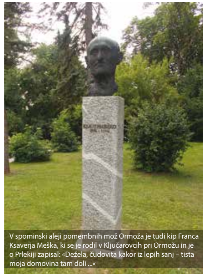
V spominski aleji pomembnih mož Ormoža je tudi kip Franca Ksaverja Meška, ki se je rodil v Ključarovcih pri Ormožu in je o Prlekiji zapisal: «Dežela, čudovita kakor iz lepih sanj – tista moja domovina tam doli ...»

Moške navezuje nase zemlja, ženske so umetnice ob štedilniku. Skupaj pa poleg vina radi prinesejo na gostinske mize svoje gibanice, pogače, postržjače, potice, kvasenice, žgance, krapce, solenke, čurke, prezwuršt, sireke, pocane murke in kakopak meso iz tünke in zobl. A kulinarčna zgodba je prava šele takrat, ko je podčrtana z bučnim oljem, ki je zaradi svoje edinstvene arome, posebnega okusa in privlačnega videza nepogrešljivo v prleški kuhinji.