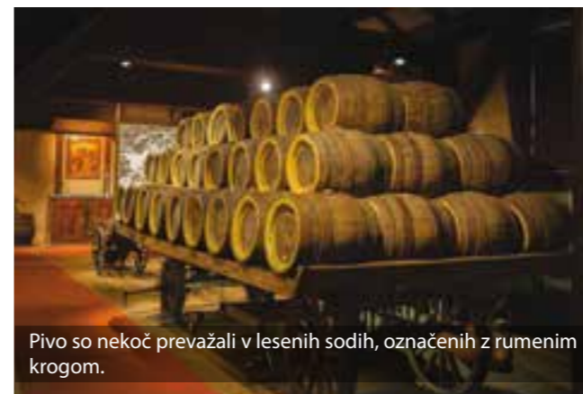
Pivo so nekoč prevažali v lesenih sodih, označenih z rumenim krogom.