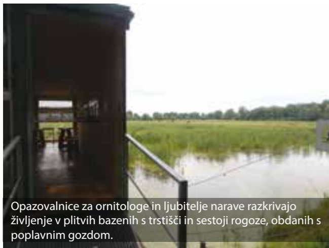
Opazovalnice za ornitologe in ljubitelje narave razkrivajo življenje v plitvih bazenih s trstičji in sestoji rogoze, obdanih s poplavnim gozdom.

Tudi turistična kmetija Puklavec iz Zasavcev sredi Ljutomersko-Ormoških goric je oaza. Dobrih jedi, odličnega vina, krepkih razgledov in prijaznih ljudi. Posebnost je domači puran, pečen v krušni peči, in martinova gos, pripravljena po domačem receptu. Čisto blizu stoji prleški klopotec, ki ima štiri peresa in krajšo zvočno desko, po kateri udarjajo kladivca. Za razliko od haloškega, ki ima šest peres in zato tudi drugačen zvok.