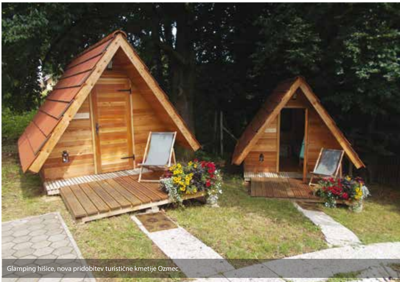
Glamping hišice, nova pridobitev turistične kmetije Ozmec