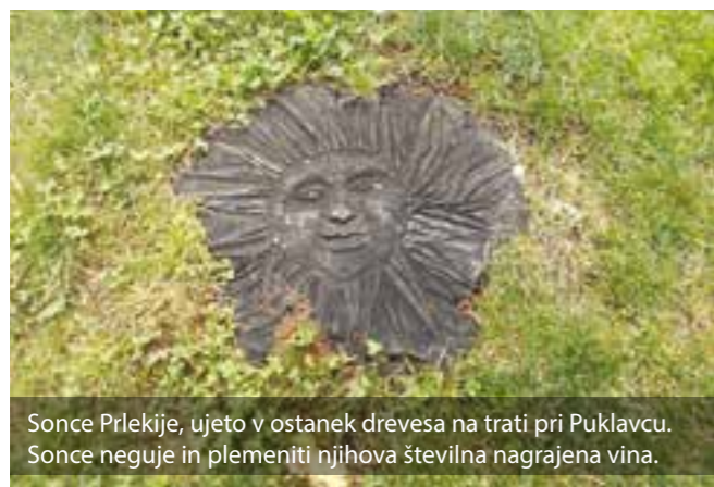
Sonce Prlekije, ujeto v ostanek drevesa na trati pri Puklavcu. Sonce neguje in plemeniti njihova številna nagrajena vina.

Na zelenju narave so svoje mestne vedute razpostavila mesta, kot so Ormož, Središče ob Dravi, Sv. Tomaž in Ljutomer ... Slednji, čeprav je blizu Jeruzalema, še vedno čaka na vstop v Destinacijo Jeruzalem. Ime je destinaciji podaril majhen zaselek na vrhu 341 m visokega griča, s katerega se v vencih kot v zelenih ogrlicah spuščajo slikoviti vinogradi. Po legendi so mu ime Jeruzalem pripeli križarji, ki so tod mimo hodili v Sveto deželo.