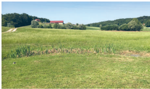
Travniki, kamor se zliva dragocena slatina iz treh vrtin.

Prostor, imenovan Dolina miru, kjer naj bi zrasle nove terme, je blizu gozda in travnikov. Zdad tu stoji prijetna majhna stavba Eko-muzej, kjer obiskovalce poučujejo s plakati o okoljskih izviri. Na eni strani priši iz zemlje mineralna voda, ki pušča za sabo močno rjavo lužo, polno železne snovi in drugih mineralov. Na drugi strani muzeja iz pipe nenehoma teče slatina, s katero se lahko odžejajo ali jo za-