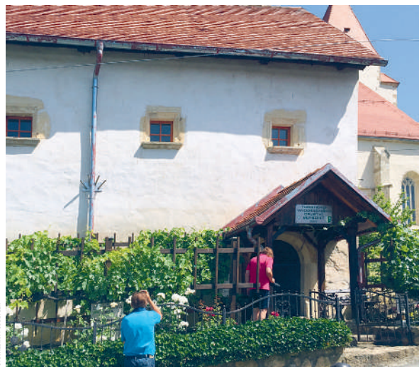
Mežnarjo obnavljajo v turistične namene, a 500 let starih kamnitih oken se ne bodo dotaknili.

Pod cerkvijo je prav toliko stara mežnarja z vinsko kletjo in staro vinsko trto. Zdad jo prenavljajo, a bodo pustili črno kuhinjo in originalna kamnita okna. Namenjena bo turistom oziroma romarjem, ki se včasih gnetejo na tem hribu, ker verjamejo, da je to kraj pozitivne energije. Na občini jamrajo, kako škoda je, da Benedikt ni zmožen sprejemati toliko ljudi, saj je prenočišč komaj za število prstov na rokah, imajo le dve turistični kmetiji, kot je Kavčičeva, kjer ti po-