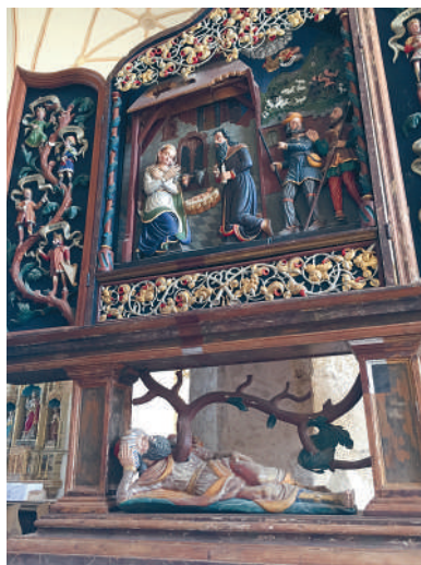
Najstarejši leseni oltar z jasicami v cerkvi sv. Treh kraljev.