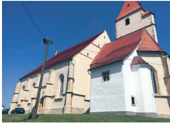
Krajani Benedikta so ponosni na svojo mogočno cerkev sv. Treh kraljev, eno starejših pri nas, ki letos slavi 500 let.