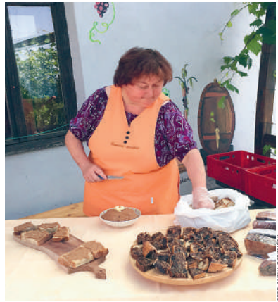
Z dobrim vinom v Benediktu postrežejo lokalno posebnost, sadno potico.