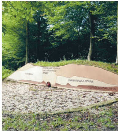
Ena od raziskanih gomil pod vasjo

goli kar 400.000, živijo pa le dve sezoni. Delo z njimi ni ravno lahko, a so po nekaj letih zelo uspešni. Vsako živalco morajo po domače rečeno, požgečkati po žlezi, da po kapljicah dobijo njeno slino. Začetka so polže ponujali restavracijam, a kmalu so prišli do zamisli, da to slino uporabijo v kozmetiki. Večji del "pridelka" gre v raznovrstne kreme, ki dobro delujejo na suho kožo, ozdravljajo izpuščaje, uničujejo glivice, ustavljajo srbečico. Zategadelj se dobro prodajajo. •