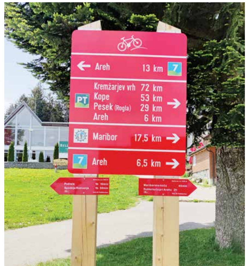
Enotno so označene tudi krožne kolesarske poti po Pohorju.