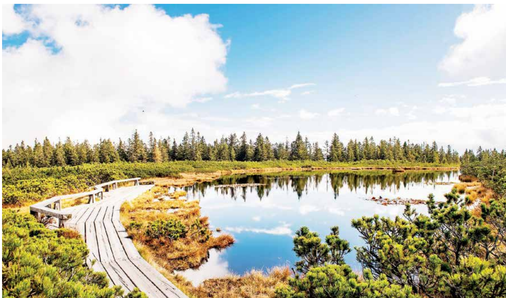
Ribnica na Pohorju je izhodišče za obisk Ribniškega jezera.