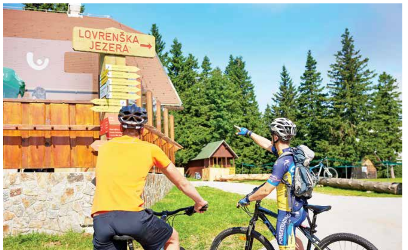
Na Rogli se vse bolj posvečajo celoletnemu turizmu.