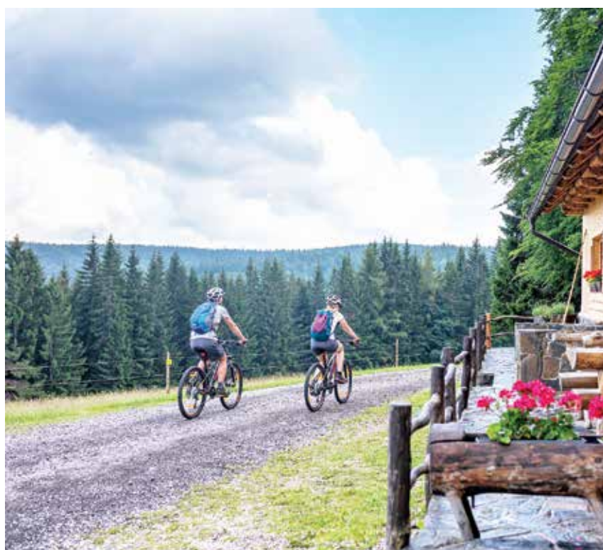
Kolesarjenje in pohodništvo sta osrednji dejavnosti za aktivno preživljanje prostega časa na Pohorju.