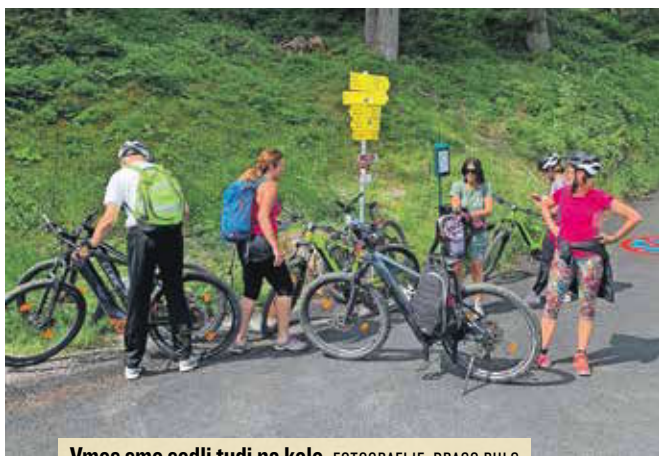
Vmes smo sedli tudi na kolo.