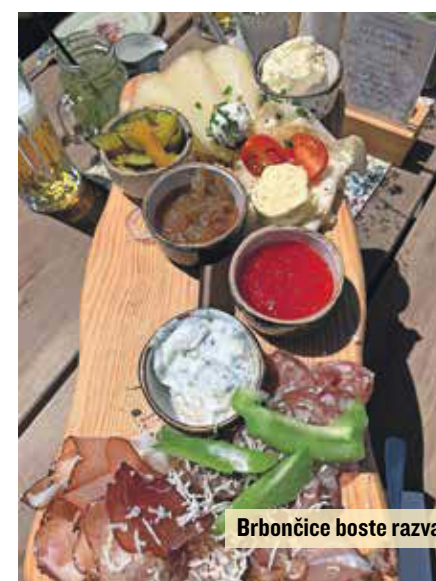
Brbončice boste razvajali.

Do planšarij so iz doline speljane lepo urejene ceste in planinske poti, ki se pogosto vijejo med visokimi smrekovimi gozdovi. Vseh skupaj jih je kar 340 kilometrov in so zelo dobro označene ter na nevarnih mestih, ki jih je sicer malo, tudi zelo dobro zavarovane. Proge, po katerih se pozimi podijo smučarji, se poleti spremenijo v poti, idealne za gorsko kolesarjenje. Ker niso preveč strme, jih zmorejo tudi tisti z manj kondicije nabiti gorski kolesarji, z e-kolesi pa so dostopne tako rekoč za vsakogar. Kolesarske poti in steze so odlično označene in opremljene s kar 24 servisnimi postajami, ki so opremljene z električnimi polnilnicami in z orodjem za najnujnejša popravila. Za vse ture si lahko najamete tudi vodnika, vse vodene ture pa imajo predvidene kulinarčne postanke, na katerih spoznate lokalne dobrote, ki so prirejene za