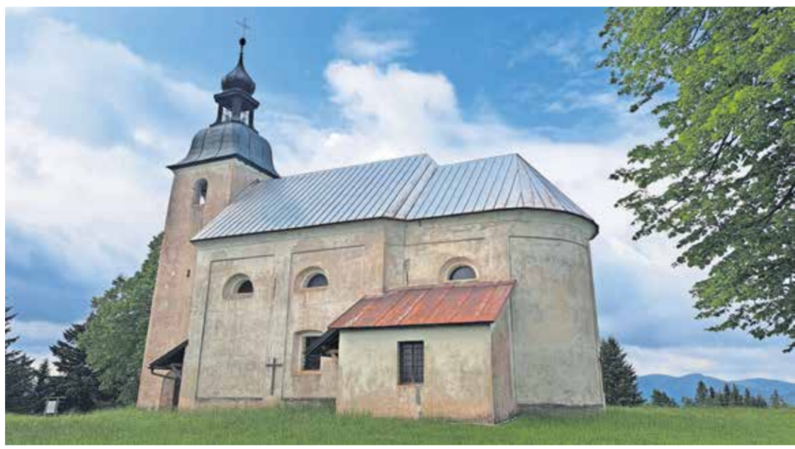
V bližini cerkve sv. Urha naj bi živel znani tihotapec.