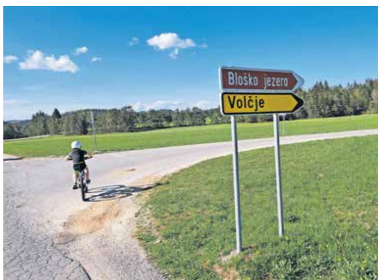
Bloška planota je zelo primerna za kolesarjenje.

ostanejo doma, jim moramo dati možnost dela in s tem seveda zasluzka,« dodaja sogovornica.