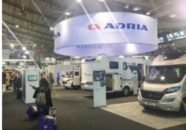
Največji slovenski proizvajalec avtomodomov Adria Mobil je že desetletja v samem evropskem vrhu.

kjer lahko med drugim prek interneta rezervirate prostor za parkiranje, se sami avtomatsko prijavite in prek teh »repcijskih robotov« opravite tudi plačilo vseh storitev. Poleg tega vam takšna avtomatska elektronska recepcija nudi še vrsto drugih na potovanju potrebnih storitev.