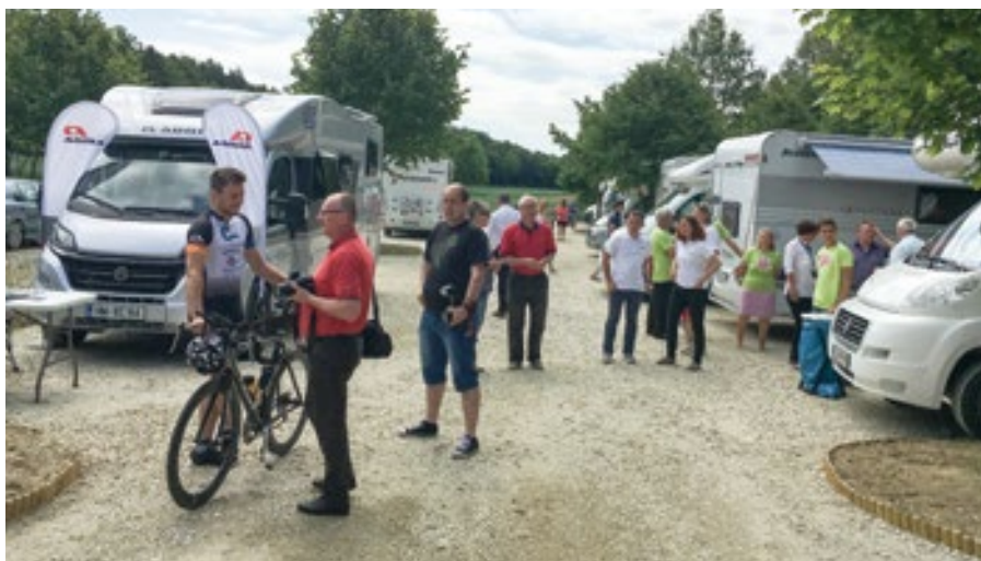
Sezonski utrip v PZA Dobrovnik ob Bukovniškem jezeru, enem najboljše urejenih v Sloveniji.

menjavanja lokacij in destinacij, kar jim je seveda hišica na kolesih omogočala. Bili so bolj podobni nomadam kot klasičnim kamping turistom. Ker so sprva lahko prespali, kjer koli so si zaželeli, so zelo redko prenočevali v kampih. Tudi zato, ker so se pogosto v poznih urah znašli pred spuščeniimi zapornicami kampov ali pa bi radi šli iz kampa na daljše poti pa zaradi zaprte recepcije niso mogli iz prostora za kampiranje. Zaradi zelo hitrega porasta števila avtodomov in posledično vse pogostejšega