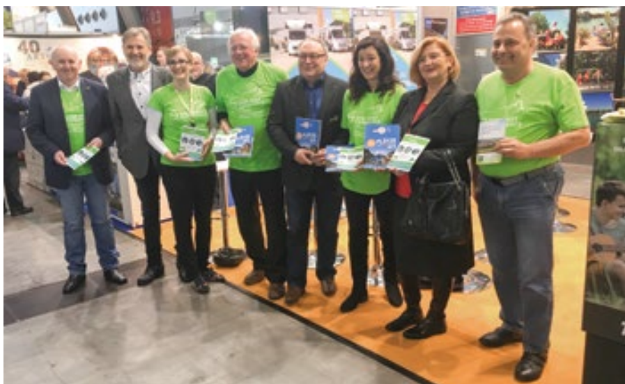
Promotorji Mreže PZA Slovenije na uspešni predstavitvi na sejmu CMT v Stuttgartu.

Mreža postajališč za avtodome pa se tako vse bolj približuje končnemu cilju, postavitvi vsaj enega postajališča za avtodome v vsaki od 212 slovenskih občin.