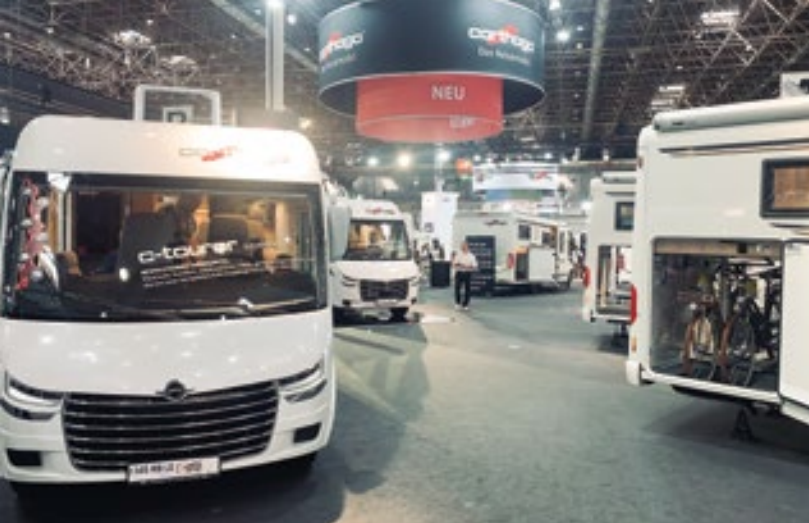
Eden najbolj uglednih nemških premijskih avtomodomov ima v Sloveniji že dve tovarni.