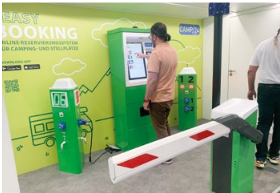
Najsodobnejša oprema za PZA, predstavljena na sejmu Caravan Salon 2023 v Düsseldorfu.

Ker je bilo karavaning turistov vse več, so jih še posebej v turističnih kra-