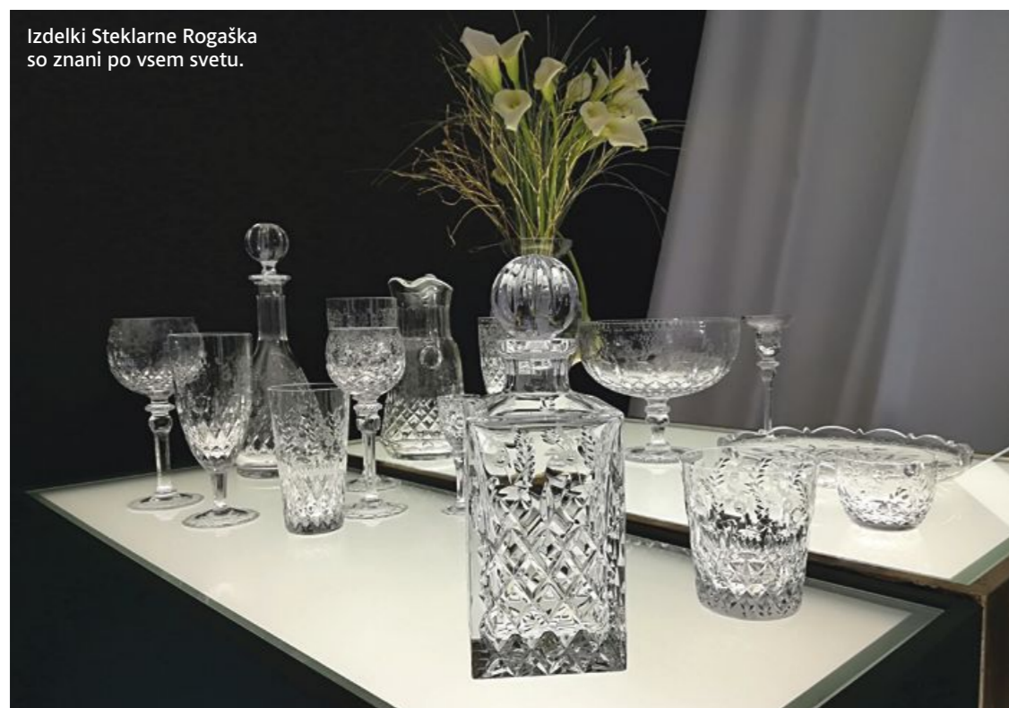
Izdelki Steklarne Rogaška so znani po vsem svetu.

Hotelski delavci ne skrivajo, da imajo pri njih kapacitete po večini zasedene zaradi zdravstvenih težav gostov (predvsem je zdravilišče specializirano za gastroenterološke bolezni), a