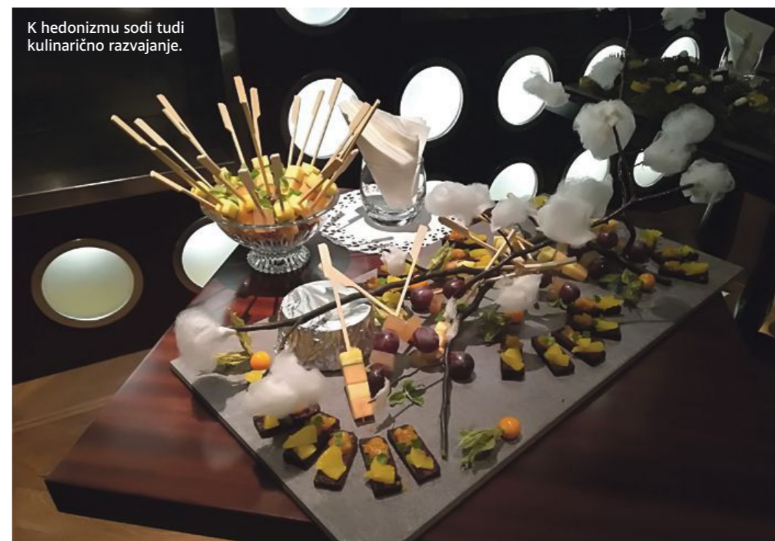
K hedonizmu sodi tudi kulinarčno razvajanje.