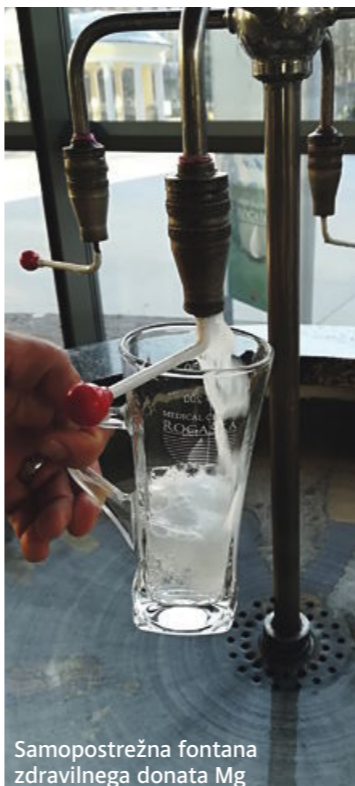
Samopostrežna fontana zdravilnega donata Mg