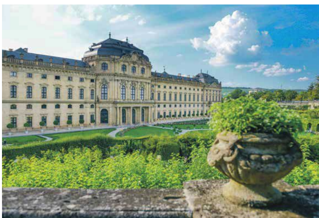
Razkošna baročna palača Würzburger Residenz je nastala po vzoru francoskega Versaillesa.

Würzburg, ki so ga poimenovali po dišavnem gradu na vrhu hriba, leži ob znameniti nemški Romantični cesti.