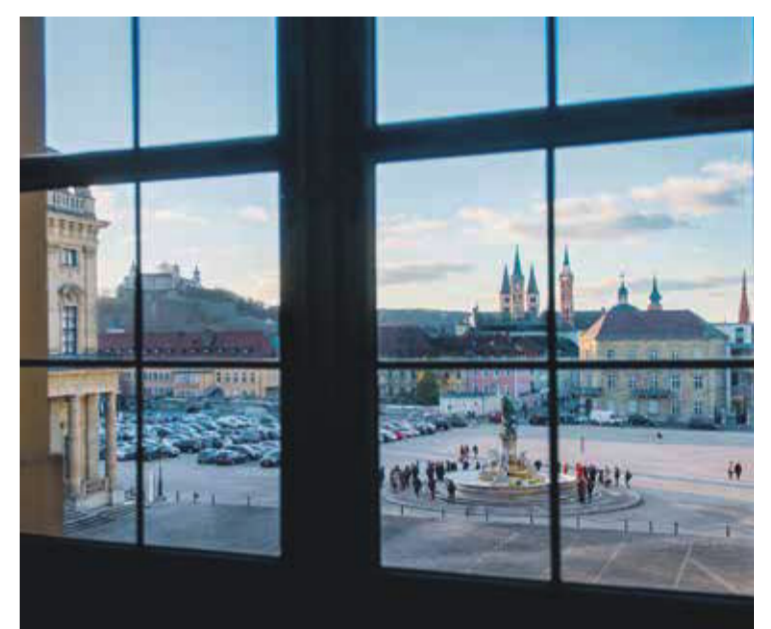
Razgled na utrbo Marienberg in würzburško katedralo