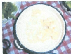
V Pomurju si je treba privoščiti dodole.

ne, to ne velja! Sploh v tem času, ko olje stiskajo na veliko. »Največ ga prodamo v začetku novembra in za božič,« pove oljarski Hari. Med degustacijo se je težko odločiti, katero je slajše: sončnično ali repično, absolutno pa je bučno. »Za liter bučnega hladno stiskanega je potrebnih 8 kilogramov bučnih semen, 20 kilogramov semen oljne repice da 5 litrov olja.« Slednjega ni mogoče kupiti – »je že oddano«, liter bučnega stane 17 evrov, liter sončničnega 6 evrov. Olja so za bogovje, se pridušajo degustatorji iz Ljubljane.