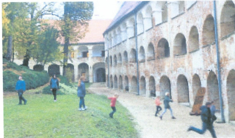
Veliki grad z zidovi, debelimi do 7 metrov

zdravjenja z zelišči, ki je bilo povezano z nadnaravnim, magičnim in skrivnostnim. »Prekmursko ljudsko zdravilstvo uporablja več kot 500 vrst rastlin za zunanje in notranje bolezni,« pripoveduje Stanka Dešnik, direktorica Krajinskega parka Goričko. V gradu, kjer je sedež omenjenega parka, je stalna zgodovinska razstava, obiskovalci si lahko ogledajo vsičen film o naravnim in kulturnim dediščini Goričkega, uživajo v dobro založeni kleti z odličnimi vini ali se poročijo in prisluhnejo koncertu v poročni in zelo