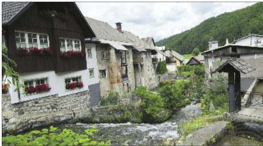
Kropa z nekdanjimi kovaškimi hišami, stisnjenimi ob Lipnici.