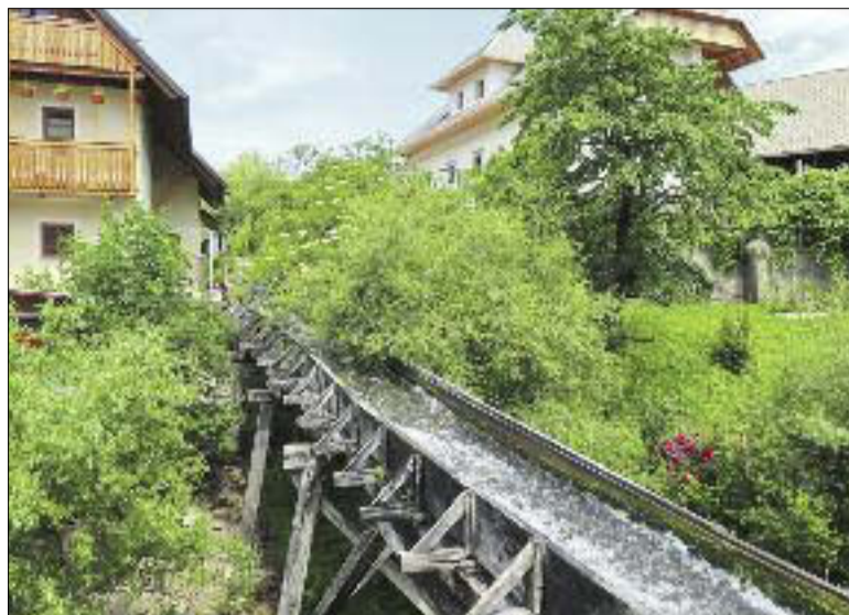
V rake ujeta Lipnica v Kamni Gorici

Ob potoku Lipnica je vrsta manjših naselij in zaselkov, prvi večji ob vstopu v dolino iz Radovljice je Lancova, čeprav po prebivalstvu še vedo skromna, Kamna Gorica z nekaj nad 500 in Kropa z okrog 800 prebivalci. Oba