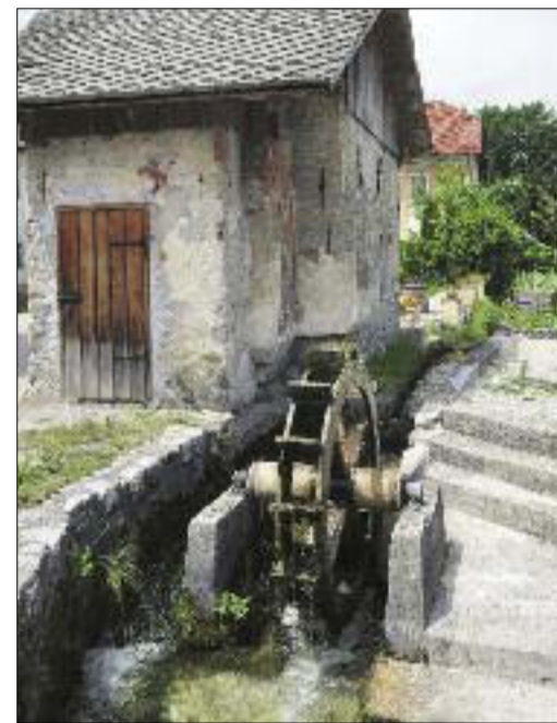
Desno: Edina ohranjena Šparovčeva kovačnica je bila navdih za Župančičevo Žebljarsko.

kraja sta znana po fužinarski in kovaški preteklosti in sta med sabo večkrat tekmovala, zato so ostale poleg stavbne in tehniške dediščine tudi številne anekdote in zgodbe kot del nesnovne etnološke dediščine. Ena od njih govori, da je kamnogoriški župnik v času pomanjkanja vaščanom obeh krajev podaril kravo, vendar so domačini pojedli vse meso, Kroparjem pa je ostala le juha – in od takrat se med seboj zmerjajo z bauharji in župarji.