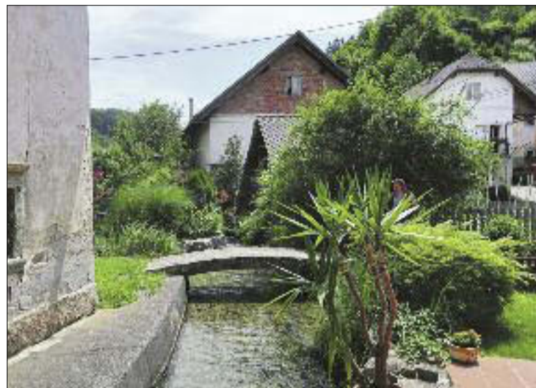
Zaradi 20 mostov in številnih kanalov je Kamna Gorica dobila ime Slovenske oz. Male Benetke.