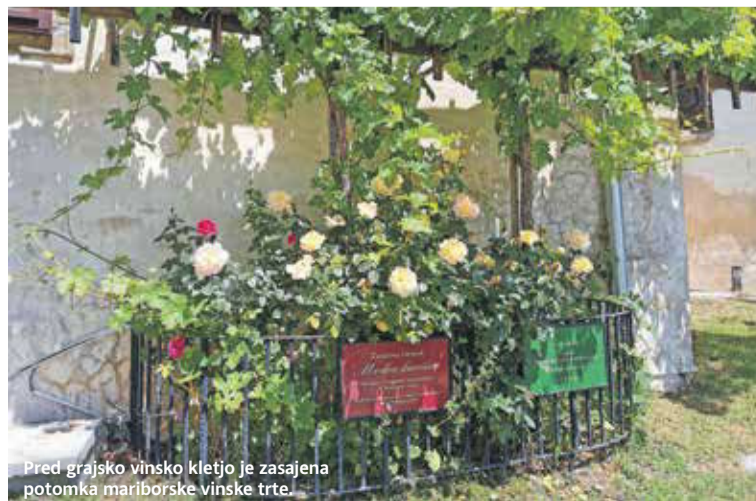
Pred grajsko vinsko kletjo je zasajena potomka mariborske vinske trte.

Cerkev sv. Jurija je kar malce skrita za Mestnim stolpom, mimo nje in kipa sv. Jurija, enega izmed zaščitnikov mesta, pridemo na teraso, s katere se odpira pogled na prostorni Novi trg z nedavno prenovljeno ptujsko tržnico. Za obiskovalce so zanimivi panoji, na katerih je predstavljena zgodovina mesta, tudi obdobje, ko